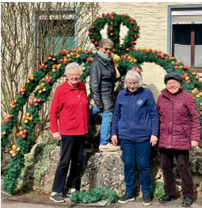
Die Damen der "Spätlese" haben auch dieses Jahr wieder den Osterbrunnen in Eschenbach geschmückt.