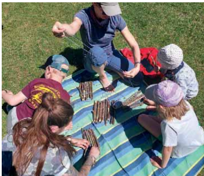
Gemeinsamer Floßbau

Natursuchspiel und Schatzsuche begleiten Familienwanderung durch Pommelsbrunner Wald.