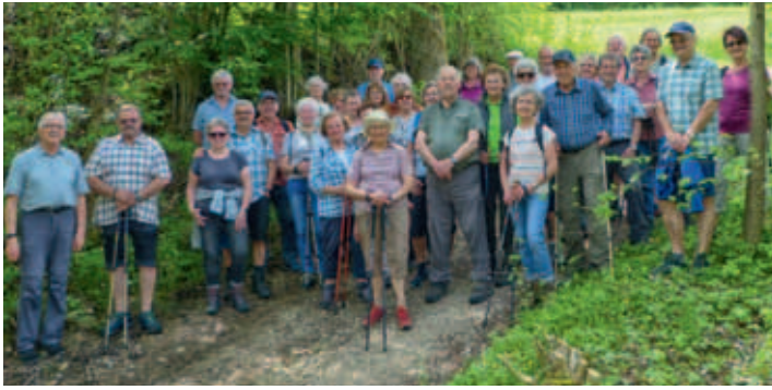
Die Gruppe am Abstieg nach Dietershofen

Liegt es es am Termin der Maiwanderung, die genau auf den 1. Mai fällt, oder überhaupt am Feiertag, dass zu dieser Wanderung die Rekordzahl von 33 Personen daran teil nimmt.