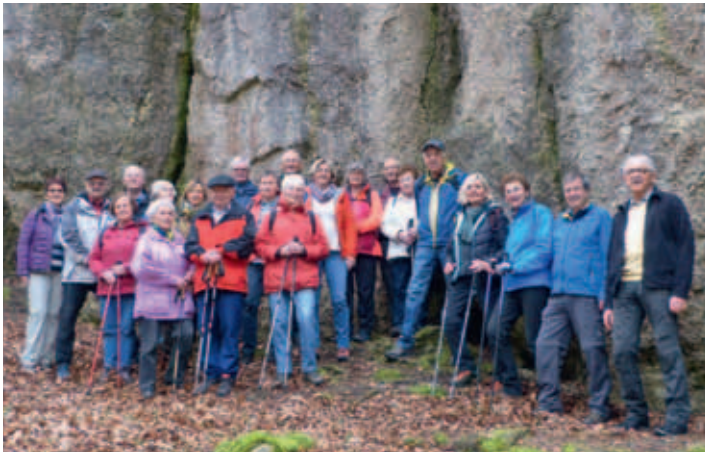
Die Gruppe am Kletterfelsen „Sieben Brüder“

Startpunkt für die Aprilwanderung ist der Parkplatz am Bad in Etzelwang. Nachdem alle 21 Tapferen vom üblichen Sammelpunkt, dem Bushäuschen bei der ehemaligen Raiffeisenbank in Pommelsbrunn, eingetroffen sind, übernimmt Bürger Hans die Führung.