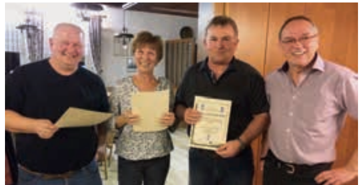
Vorstand Zagel mit den anwesenden Geehrten für 40 Jahre